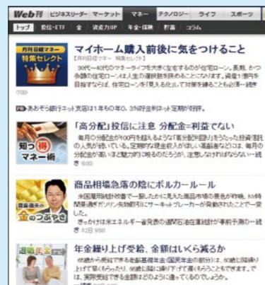
「マネー」セクションでは、初心者向け入門編や金融商品情報を満載する