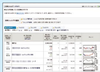
気になる銘柄は、「銘柄フォルダ」に登録しておく