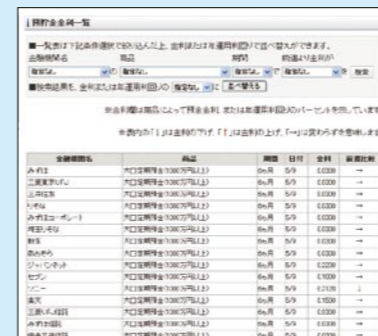
「マネー」の「貯蓄」で、主要金融機関の預貯金金利一覧が見られる