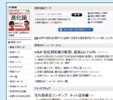
自分に合った投信を探せる。「マネー」の「投信・ETF」も便利だ