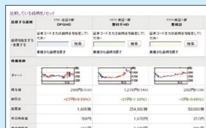
「銘柄比較分析レーダー」で、個別株を比較できる