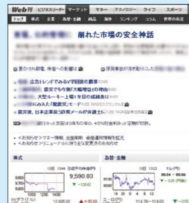
「マーケット」セクションでは、投資と金融に関する独自情報を集約する