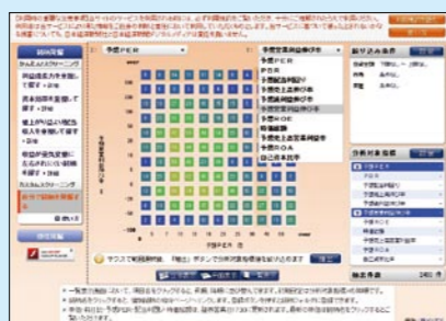
有望株を探したいなら「銘柄発掘ツール」