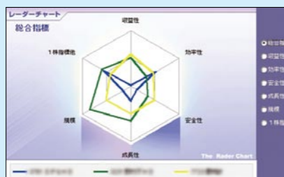
個別株をレーダーチャートで比較する