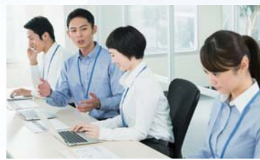
同じテーマの情報を共有していると、プロジェクトが活性化する。