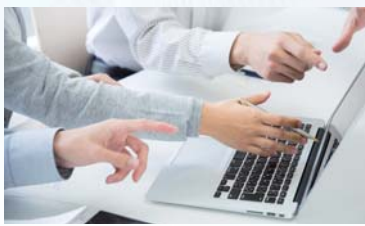
同じチームなら、最低限このくらいの情報はつかんでほしい。