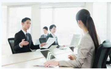
もっと若手社員とのコミュニケーションを図りたい。